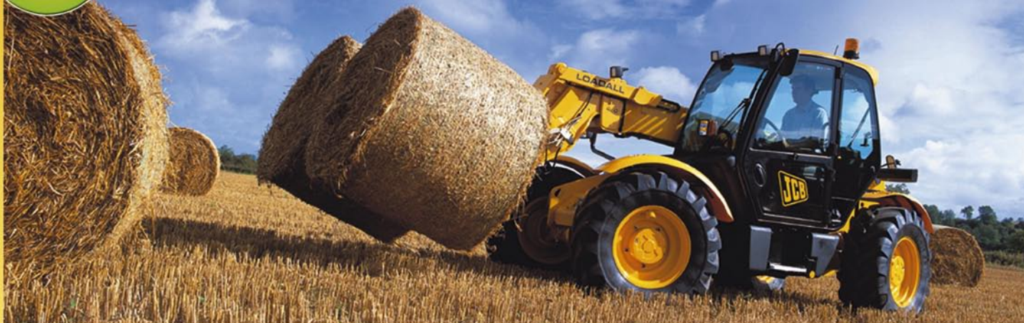
JCB Teleskop mit Ballengabel bei der Heuernte