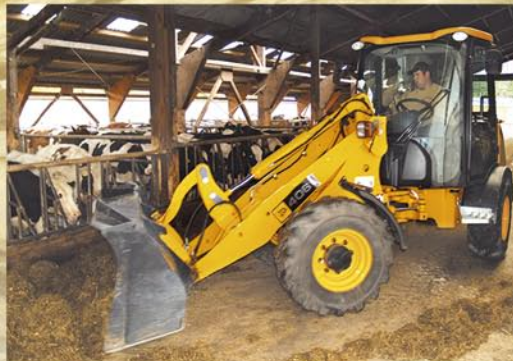
Kompakt-Radlader 406: extrem wendig, z.B. beim Ausmisten des Stalls