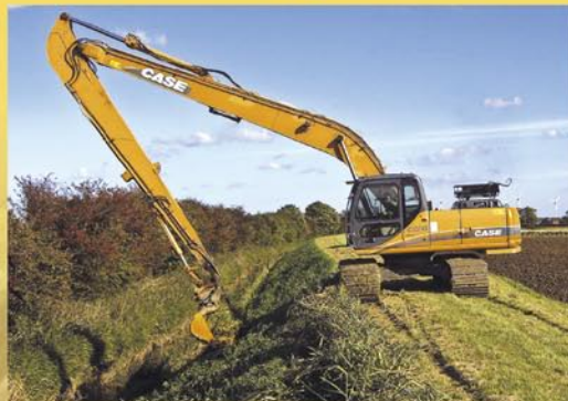
Kettenbagger mit LongReach- Ausrüstung und Graben- räumlöffel beim Ge- wässerschutz