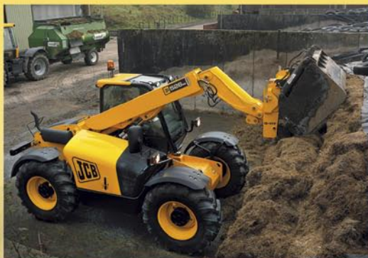
JCB Teleskop 526-56 Agri mit Silagezange beim Anlegen einer Miete